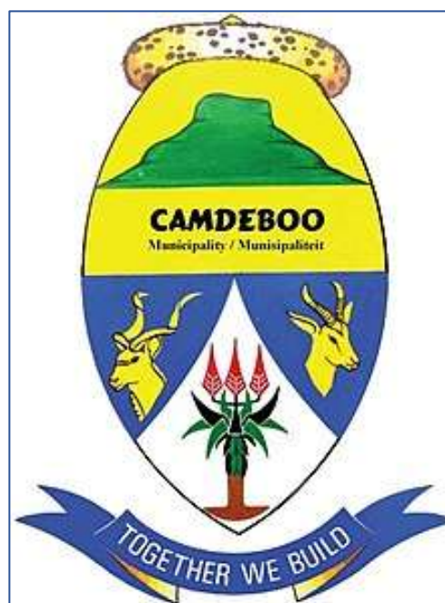
Camdeboo Munisipaliteit Wapenskild (2004)

nuwe Camdeboo Munisipaliteit ('n samesmelting van die munisipaliteite van Graaff-Reinet, Aberdeen en Nieu-Bethesda) aansoek gedoen om 'n nuwe wapen by die Buro vir Heraldiek te registreer. Hierdie wapenskild word soos volg beskryf: Wapen: deursnede van goud en benede ingeboë kepergewys deursnede van blou en silwer, in die skildhoof 'n voorstelling van die Spandaukop in groen en in die skildvoet 'n groen boomaalwyn met drie rooi blomme en bruin stam tussen regs 'n afgesnede koedoebultkop en hals en links 'n afgesnede springbokkop en hals, afgewen, albei van goud. Die skild is oortop van 'n luiperdvelkopband van natuurlike kleur. Die leuse: saam sal ons bou. Hierdie wapen is op 12 Maart 2004 geregistreer en 'n sertifikaat (H4/3/2/716) is uitgereik. 2