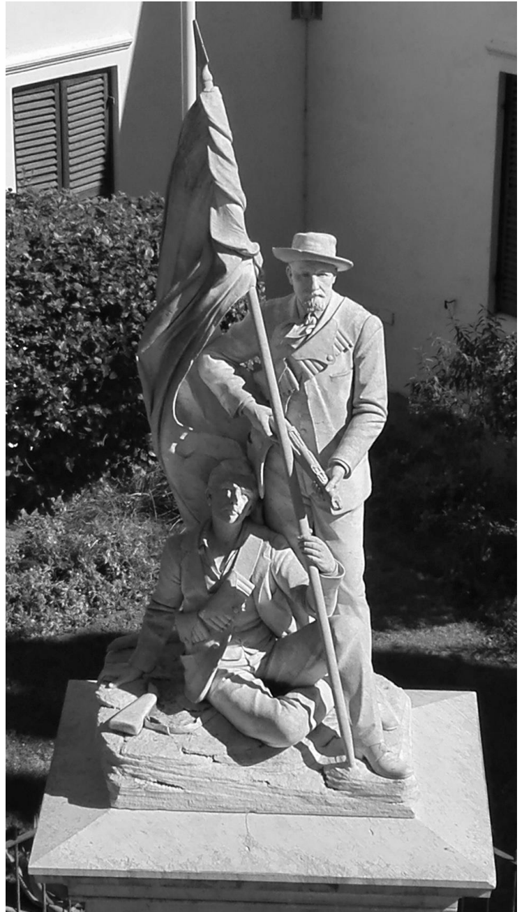
Figuur 3 Monument met gebreekte geweer, langs die gevalle kryger

Tensy anders vermeld, kom die inligting vanaf Loock, Johnnie (1952) Offisiële Gids van Graaff-Reinet uit die privaatversameling van Johan Loock. Die argieffoto's in Figuur 1 kom vanaf die internet, Figuur 2 uit die Graaff-Reinet Museum en Figuur 4 uit die privaatversameling van Paul van den Berg. Die res van die foto's is deur die skrywer geneem.