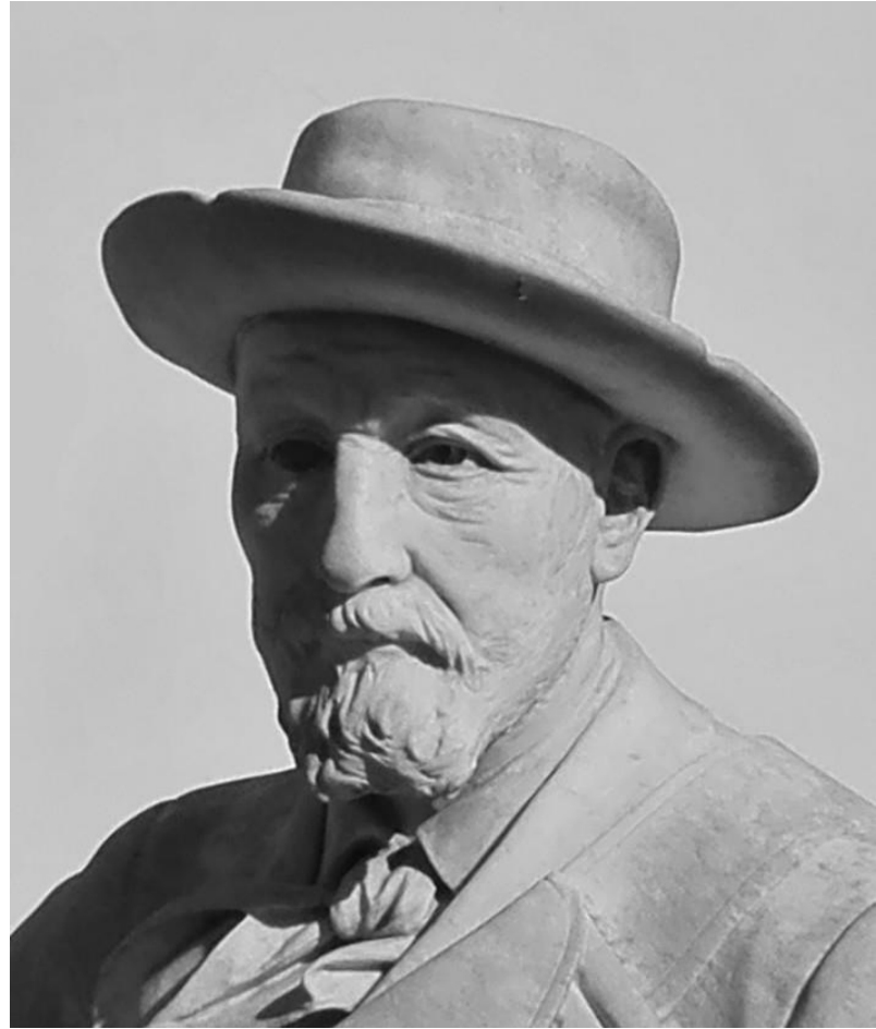
Figuur 1. Generaal de Wet: Vergelyking tussen skets en beeld.