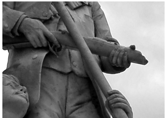
Figuur 4. Geweerloop en geweerband: toe en nou.